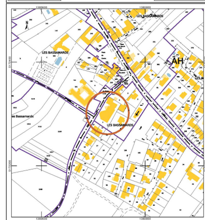
Plan de situation 1/2000ème